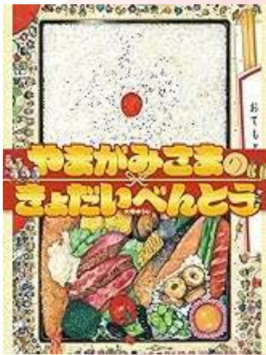
やまがみさまの きょだいべんとう 大串ゆうじ/偕成社