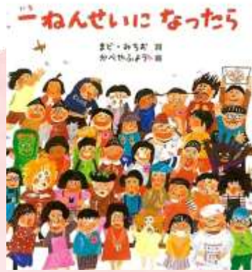
一ねんせいになったら まど みちお・詩 かべやふよう・絵 /小峰書店