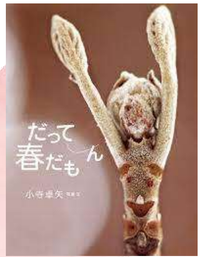
だって春だもん 小寺卓矢 写真・文/アリス館