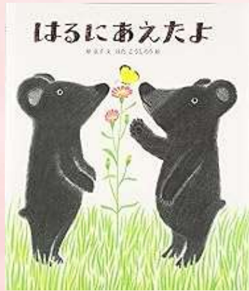
はるにあえたよ 原 京子・文 はたこうしろう・絵 /ポプラ社