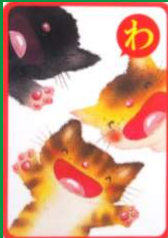
日本のことわざかるた 西本鶏介・文 いもとようこ・絵/ポプラ社

しがつ 四月の「ことわざ」 これ、な〜んだ？ むかし ひとひと あいだ い った 昔から人々の間で言い伝えられてきた、 せいかつ ちえ おし ことば 「生活の知恵」や「教え」を言葉にした、 ことわざ。 みな 皆さんは、いくつ知っていますか。 たとえば、