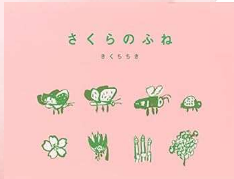
さくらのふね きくちちき/小峰書店