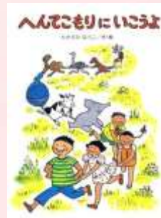
へんてこもりにいこうよ たかどのほうこ/偕成社