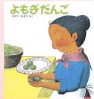
よもぎだんご さとうわきこ/福音館書店