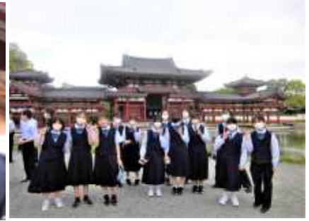
3年修学旅行（京都・奈良）